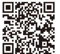
大野城市議会HP 意見書ページ

※個人情報については、ご意見などの内容について不明な点があり、直接ご確認させていただく場合にのみ使用させていただきます。