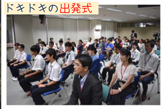
ドキドキの出発式