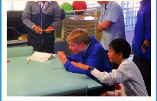
射的をしゅくチャーしました

小学校を訪問し、折り紙や射的などを通して交流しました。現地の小学生たちは、とっても可愛かったです。