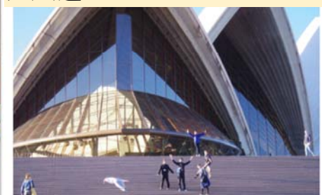
巨大過ぎるオペラハウス