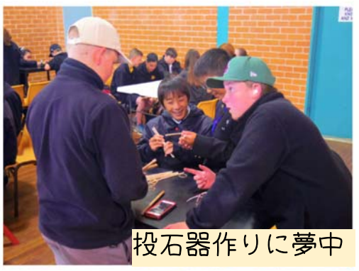
投石器作りに夢中

オレンジハイスクールはとてもキレイな学校でした。ホスト学生と一緒にたくさんの授業を体験しました！