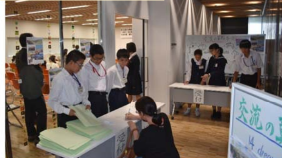
受付も自分たちで