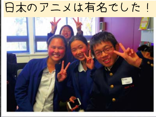
日本のアニメは有名でした！