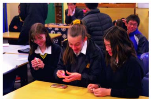
金太郎飴に喜んでくれた♪

事前研修でしっかり準備してきた日本文化の紹介をしました。初めは緊張したけど、笑顔で発表できました。