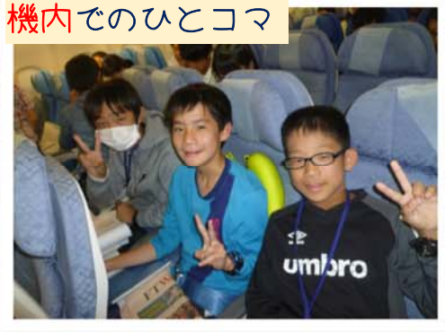
機内でのひとコマ

出発式ではたくさんの激励の言葉をもらいました。多くの人に見送られながら香港経由でシドニーに飛び立ちました！