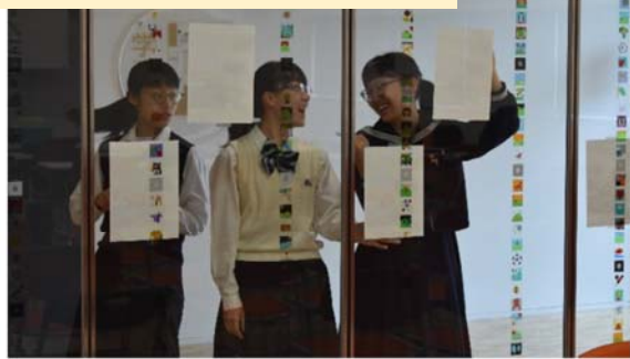
会場準備もしっかりと