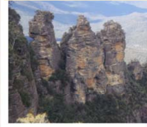
絶景！ブルーマウンテン

8日間お世話になったホストファミリーとのお別れをしました。思い思いに感謝を伝えました。シドニーまでの道のりでは、世界遺産のブルーマウンテンや動物園を見学しました。オペラハウスを間近に見ることもできました！