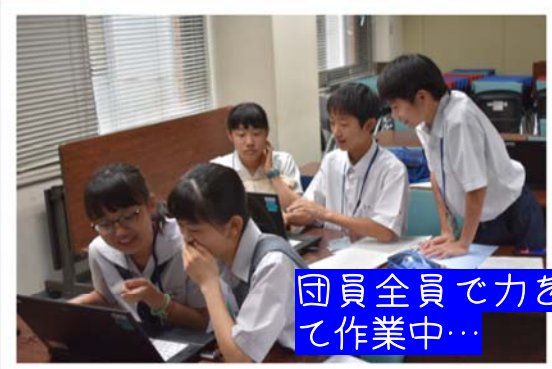
団員全員で力を合わせて作業中…