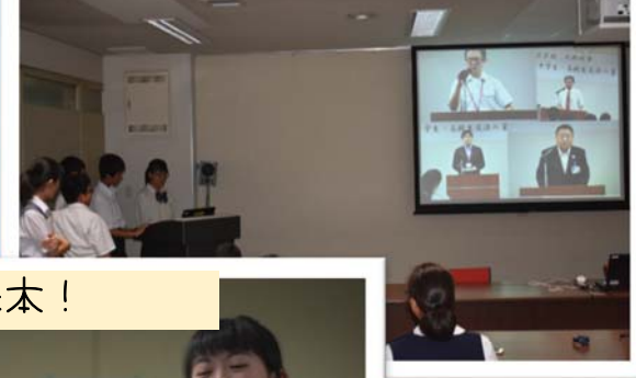
報告会の練習風景