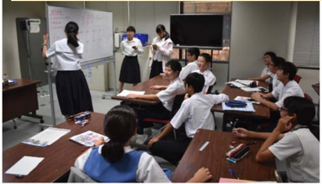
全員で色々な意見を出し合いました