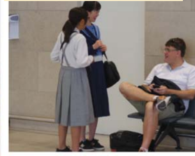
インタビューゲーム