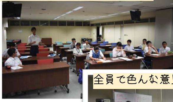
まずは本研修の振り返りから