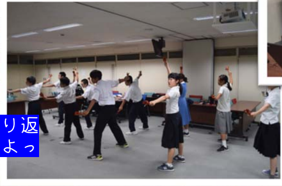
よさこいを披露するために繰り返し練習しました。「よっちょれ、よっちょれ、よっちょれやあ！」