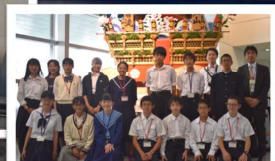
本研修の締めくくり

乗換え先である香港空港では、インタビューゲームをしました。見知らぬ外国人に行き先などを尋ねました。みんな優しく答えてくれて嬉しかったです。福岡空港では解散式の後、団員全員で記念撮影をして本研修を終えました。