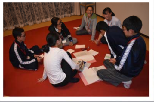
オーストラリアでどんな日本文化を紹介するか話し合い中…