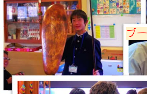
ブーメランの絵付けに挑戦