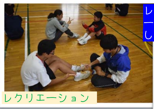
レクリエーションで、一気に距離が縮まりました！

宿泊研修を通して、団員の絆を深めました。また、日本文化の紹介内容について話し合いました。