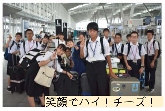
笑顔でハイ！チーズ！