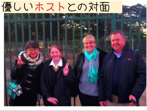
優しいホストとの対面