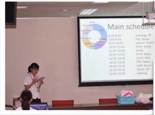
「日本人の一日のスケジュール」と「和菓子」をテーマに発表練習しました！