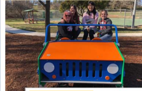
車(?)に乗った記念に

土日の休みには、ホストファミリーとゆったりと過ごしました。たくさんの場所に連れて行ってくれた、優しいホストファミリーに感謝です！