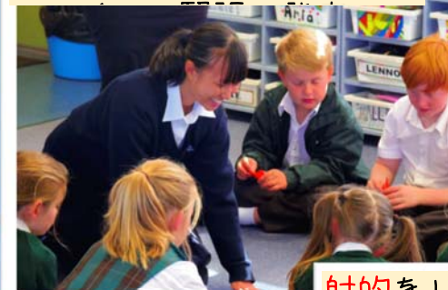
折り紙上手に折れるかな？

小学校を訪問し、折り紙や射的などを通して交流しました。現地の小学生たちは、とっても可愛かったです。