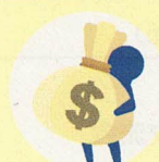
海外通貨での買い物疑似体験