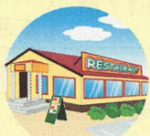
海外レストランでの疑似体験