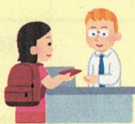
出入国・税関疑似体験