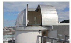
▲スタードームまどか外観