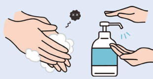
手洗い・手指消毒