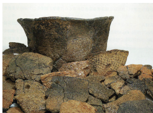
上大利で発見された縄文土器 (約8000年前)