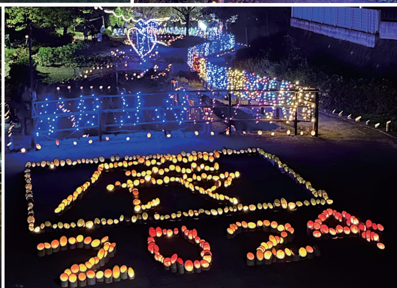
【表紙写真】 どんぼの森 光の祭典 (令和5年12月3日撮影)