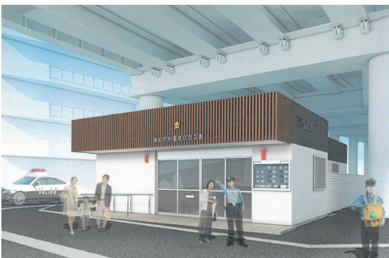
春日原交番完成イメージ図