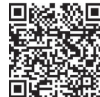
狂犬病予防集団注射日程表

はがきが届いていない人や今回初めて登録する人は、会場で受付票に記入してください。