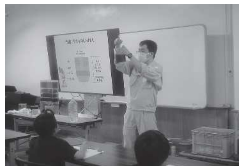
昨年度人気講座 水の循環（企業総務課）