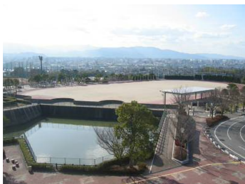
(まどかパーク (大野城総合公園))