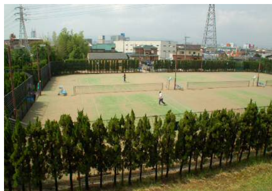
(赤坂テニスコート)