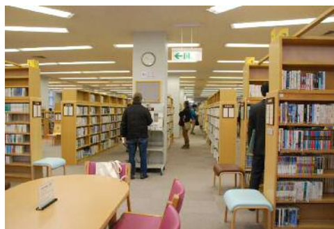
（まどかぴあ図書館）