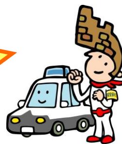
大野城市 PR キャラクター 大野ジョー

大野城市では、地域の防犯、防災・防火、暴力団排除及び交通安全（飲酒運転撲滅含む）活動に取り組んでいただける事業所を募集しています。地域と共働して全ての市民が安全に安心して暮らすことができる地域社会づくりを担いませんか。