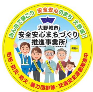
ステッカー (様式5号)