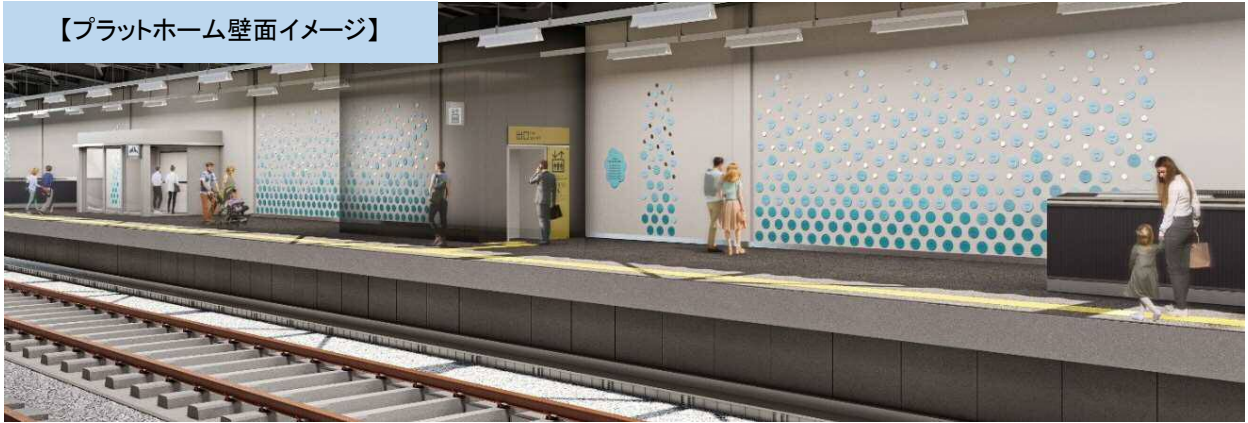
【プラットホーム壁面イメージ】

【まどかプレート】 参加者(寄附者)の公表方法として氏名等を銘字します。 水色を基調とした直径18cmの金属プレート(色は選べません) 募集数 限定685口 参加費(寄附金)1口10,000円 ふるさと納税制度適用(※1)